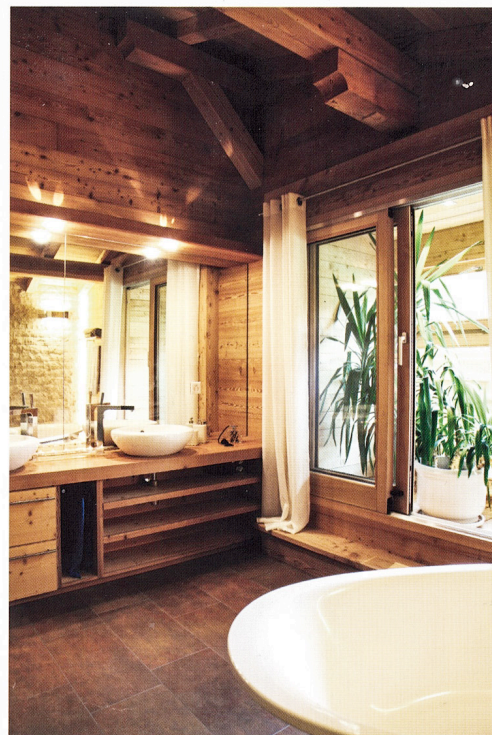
Le mur de quartzite marque aussi le cloisonnement d'une salle de bains, où tous les éléments de bois, structure, mobilier et menuiserie sont en mélèze, façonné dans les ateliers des chalets Bayrou.

plus de mille réalisations, ce savoir-faire s'était cantonné aux frontières de l'hexagone.