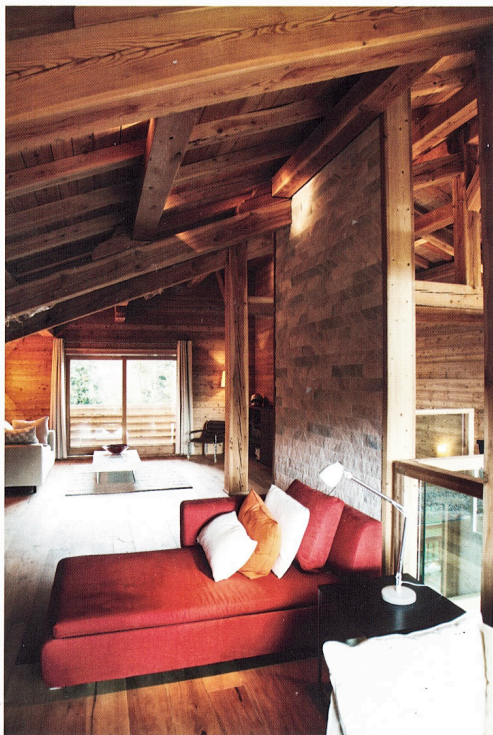
Sous les toits, de grands espaces traversants et ce mur en quartzite qui prend sa source dans la cave à vin et s'élève jusqu'au sommet de la construction, apportant sa minéralité et ses tonalités claires.